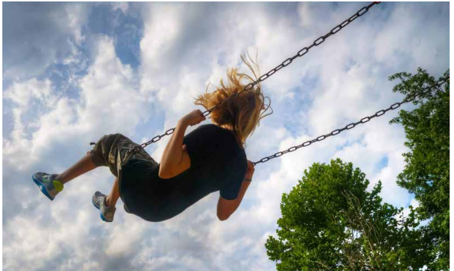
Deja salir ese niño que llevas en el interior.

La terapia centrada en el Niño Interior es un enfoque popular el cual se centra en ayudar a las personas a reconectar con su niño interno a través de técnicas como la meditación, la hipnosis, el teatro pánico, la visua-