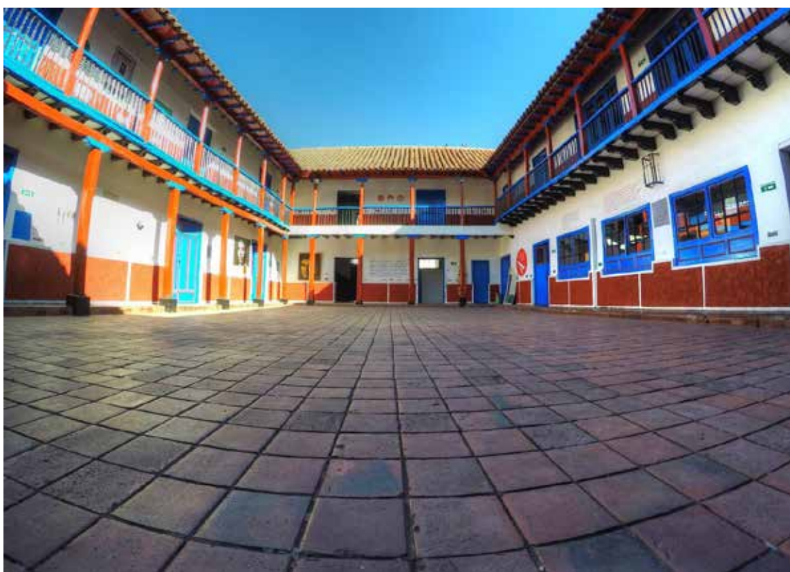
Instalaciones del Liceo Nacional de Varones de Zipaquirá.

Los pasajeros trasbordaron al tren en Puerto Salgar rumbo a Bogotá. Un señor elegante, que había escuchado a Gabriel en el vapor, se le acercó y le pidió que le copiara la letra de uno de los bo-