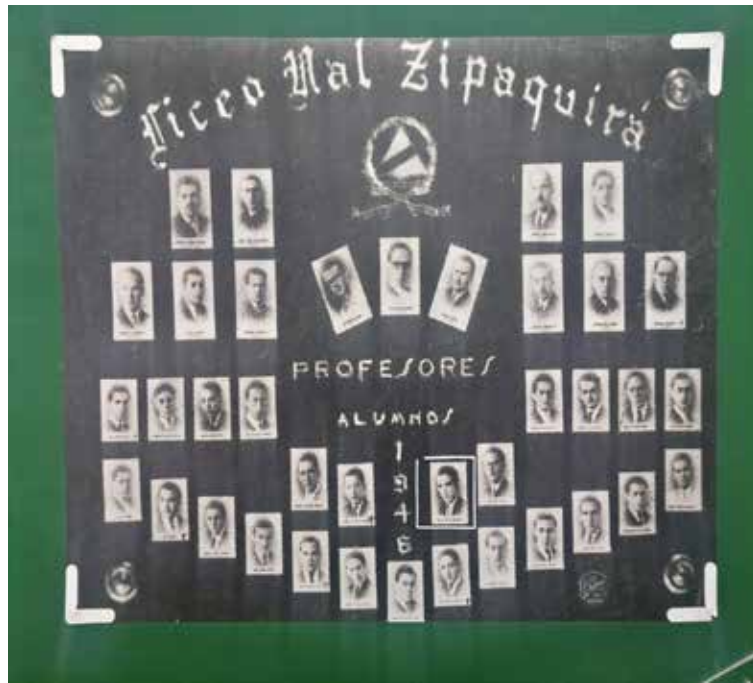
Fotografía del mosaico de los profesores y alumnos de la promoción de 1946 del Liceo Nacional de Varones de Zipaquirá, en el recuadro se puede ubicar a Gabo.

Cuando llegó el momento de franquear el gran portón del Liceo, cuya inmensa edificación ocupaba una cuadra, a Gabo