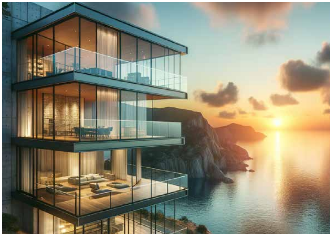
Una imagen de IA. Edificio arquitectónico moderno con grandes ventanales de vidrio, situado en un acantilado con vista a un océano sereno al atardecer.

En cumplimiento del compromiso del Gobierno del Cambio de convertir a Manizales en vanguardia tecnológica y de posicionar a Colombia como país líder en inteligencia artificial de Latinoamérica, el presidente Gustavo Petro lanza hoy, en el coliseo de la Universidad de Caldas de esta ciudad, la primera Facultad de Inteligencia Artificial e Ingenierías no solo de Colombia sino también de América Latina y el Caribe.