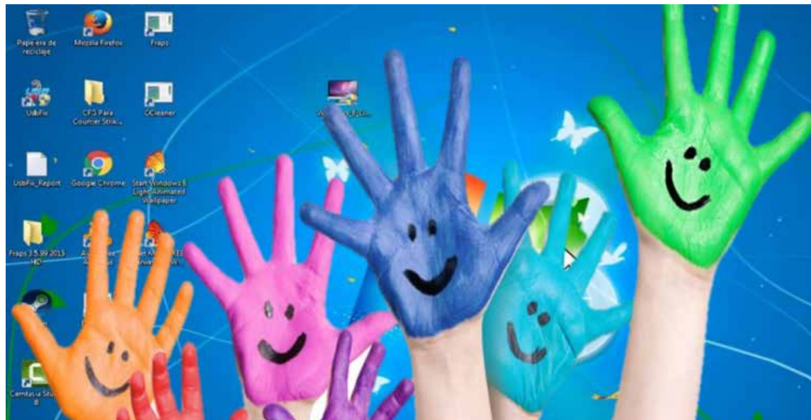
La mitad de los niños latinoamericanos tiene cuenta en redes sociales y el 15% de los padres desconoce por completo la información que su hijo.

Según los adultos encuestados, lo que más comparten los menores públicamente en sus perfiles es información sobre