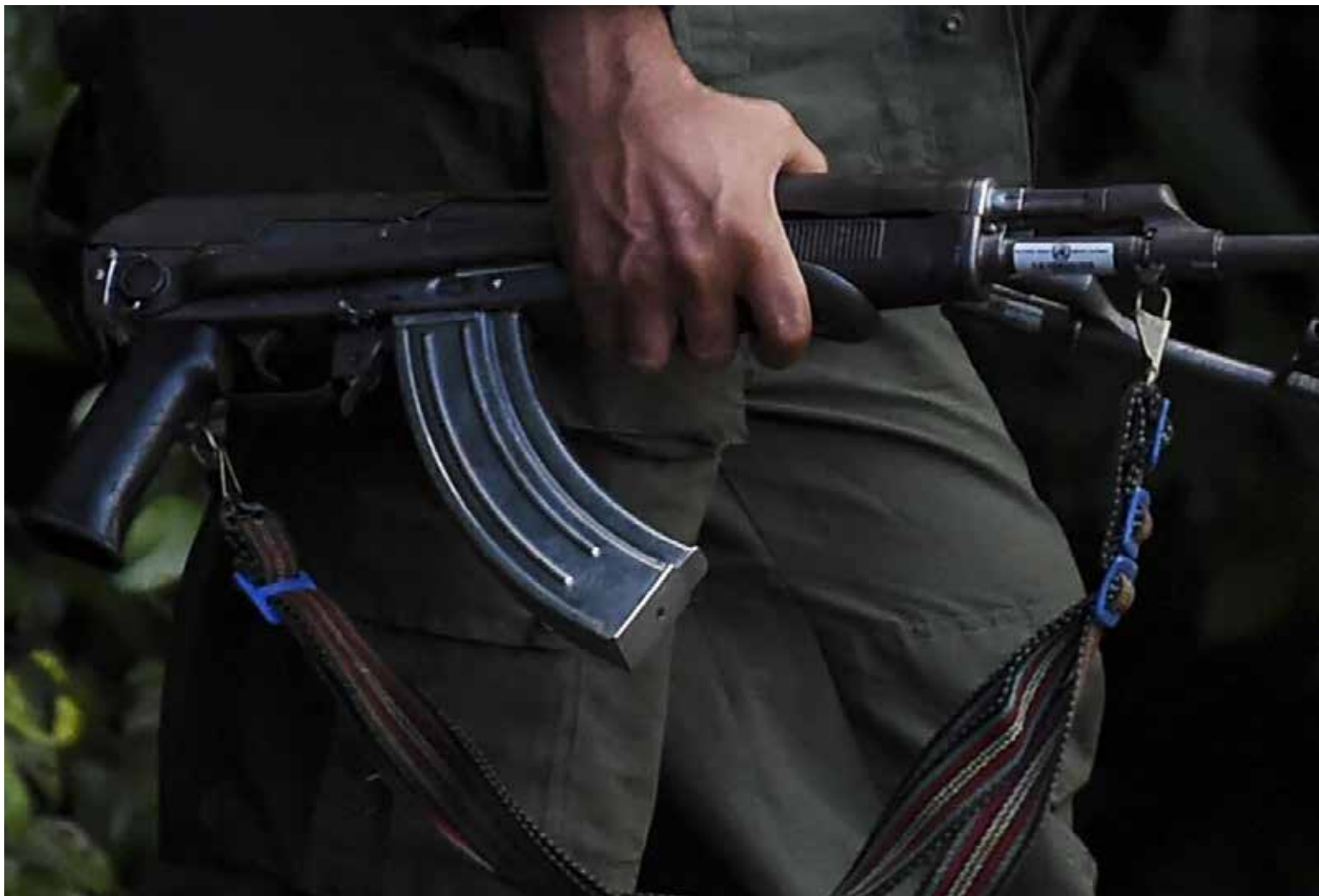
Grupos armados ilegales.

La batalla por Barranquilla es una pelea entre los gaitanistas y las otras bandas armadas que habían sentado sus reales en la capital del Atlántico.