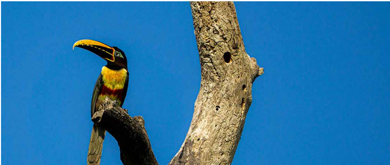
Pichí bandirrojo o tucanillo, una especie de ave que habita en el Casanare

«Hace diez años era una locura traer turistas extranjeros a algunas zonas de Colombia. Ahora no solo es posible, sino que se ha abierto una gran puerta para la ciencia y para la economía del país».