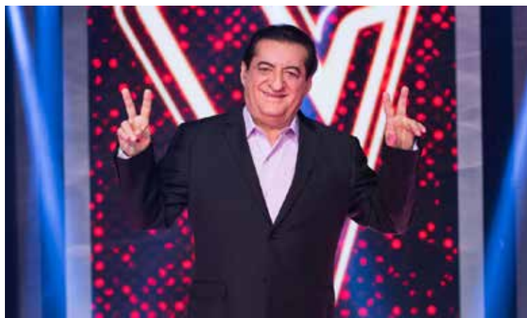
Jorge Oñate, se destacó por su voz lírica, siendo bautizado primero «El Ruseñor del Cesar» y, posteriormente, «El jilguero de América».

Oñate, con una sonrisa a flor de piel, poseía una voz que resonaba en el ambiente. Cuando era presidente de Sayco, en el segundo piso decían: «Llegó Oñate!», pues su voz se escuchaba desde la portería. Lo acompañé como